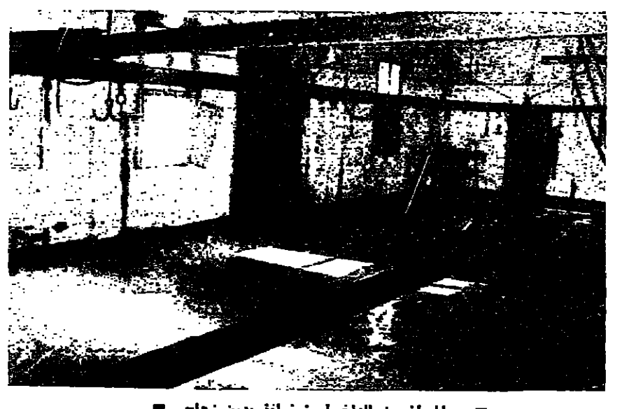
والمسلم من الداخل: نواتج بدون زجاج

صيدا - من مراسل «الانوار»: قضية مسلم صيدا كقضية «ابريق الزيت» اذا ان الخرائط والتقسيمات المأتمنة لبناء المسلم الجديد جاهزة، منذ اكثر من (سنوات، وحين بدأ العمل على تحريكها، اتت الاحداث فخرت ذلك. واليوم وبعد عودة الحياة الطبيعية الى لبنان، ووجود الاموال المخصصة لذلك في خزنة بلدية صيدا، عاد الصوت يرتفع مجددا. باعتبار رئيس بلدية صيدا السراع بعملية انشاء المسلم الحديث خاصة وان اوضاع المسلم الحالي، لا تطاق محيا وجغرافيا وبشريا. ولهذه الاسباب كان اجناع اللجنة البلدية في صيدا والعمل على تحريك قضية المسلم. ويقول الذين يعملون في المسلم ان اوضاعه سيئة وتهدد بشلل صحية سيئة ايضا. حتى ان السيارة المخصصة لنقل للحموم، صاعد على نقل الوبئة الى للحموم نظرا لان داخلها غير صالح لنقل للحموم، فغرضها غير مقبلة تماما مما يؤدي بالذات الى نقل الوباء، عبر الجيوب التي في قاعها من جراء قلب الحاويات اثناء سير السيارة، وتفكيها الى اللحم المعلقة في سقفها. ويقول المسؤول عن السيارة انه قام ببرامجات مع المحافظ لسد الثغرات الكثرة من داخل السيارة والتي تؤدي بالطبع الى نقل الوباء الى للحموم، لكن كافة المراجعات ذهبت بدون جدوى. المطالبة برسوم على للحموم المجلدة من جهة ثانية طلبت الجيوب من صيدا مسن المسؤولين العمل على فرض رسوم على اللحم المبرد المسعود من الخارج، كالترسوم التي تقاضها البلدية عن اللحم الطازج، وقال القصاب محمود شمس الدين على المسؤولين في بلدية صيدا مطالبة بلقي للحموم البرد المسعود، بوضع ضوابط تشري الى انه يبرده وان على المواطنين الصحن ان يقوموا بجولات لهدد الغاية.